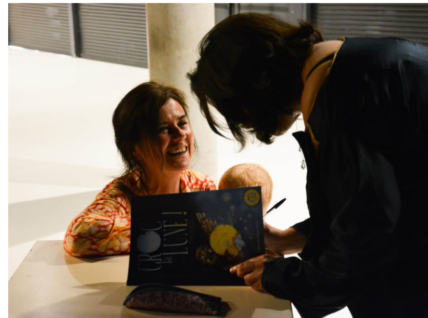
SIGNATURE DU LIVRE AVEC AUDIO APRES LE SPECTACLE