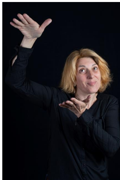
SPECTACLE EN DUO AVEC UNE ARTISTE LSF