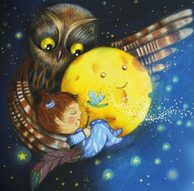
Illustration Marie-Pierre Emorine

De et Par Claudia Mad'moiZèle www.claudia-madmoizele-conteuse.fr