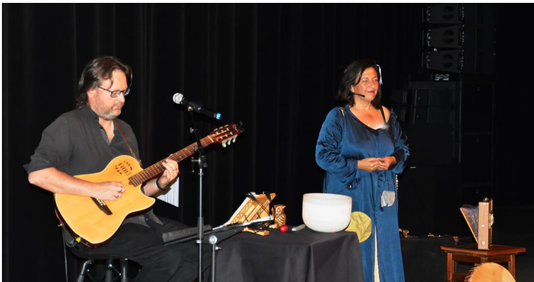
SPECTACLE EN DUO AVEC UN MUSICIEN